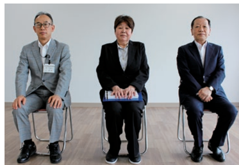
永年勤続 表彰状授与式