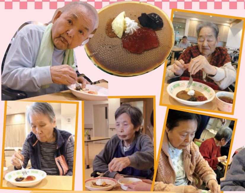
おやつに 焼きたてパンケーキ