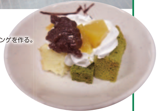
※ご利用者が食べやすいように、すなみ荘では一口サイズにケーキをカットしデコレーションしました。