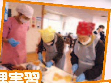
コロナで中止していたため、久しぶりの調理実習でした!手慣れた様子で切ったり盛り付けたり!皆で協力して美味しくできました!