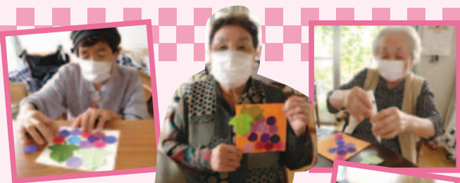
ブドウにリンゴ…、今回は秋の実りを作りました。「きれいな色ね」「おいしそう!」「上手にできた?」皆さん喜んで集中して作られました。