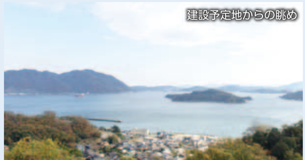
建設予定地からの眺め