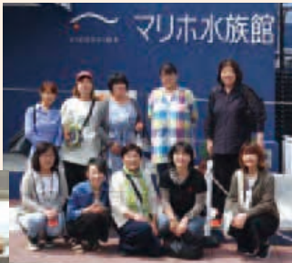
6月13日 広島方面旅行 マリホ水族館にて 6月28日 岡山方面旅行 ホテルリマーニ&スパにて