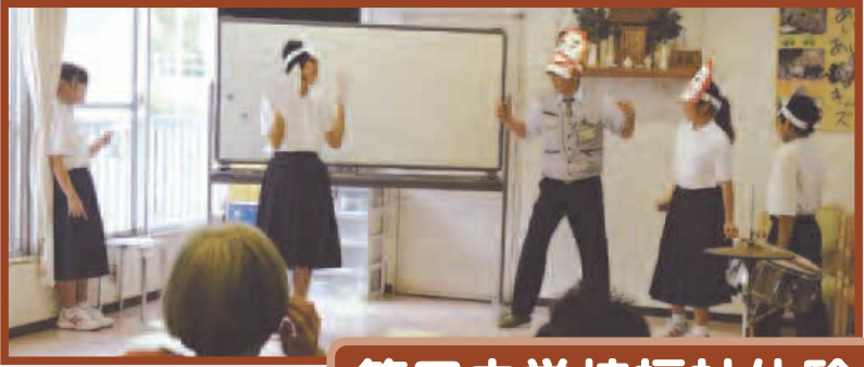
第四中学校福祉体験

1年生のみなさんが来荘され、福祉機器を体験したり、劇や昭和クイズなどを披露して下さいました。