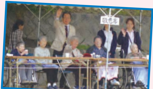
須波小学校運動会