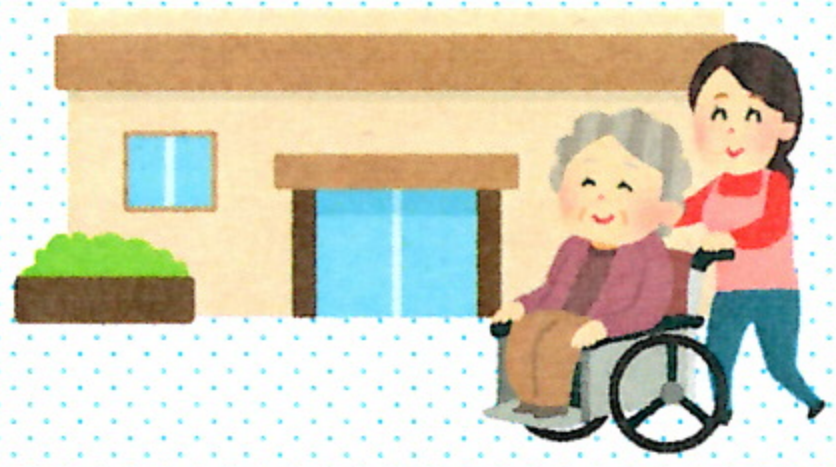
介護老人福祉施設サービス評価項目(特養・令和4年3月)