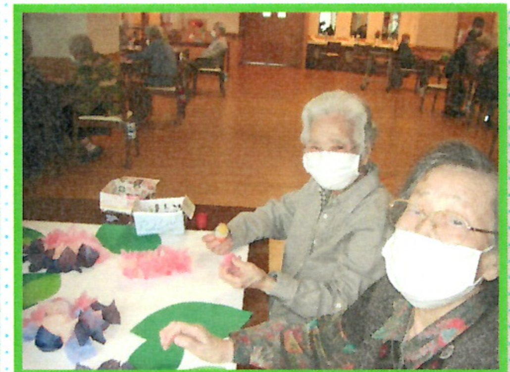
デイサービスではあじさいの花を手作りしましたよ。