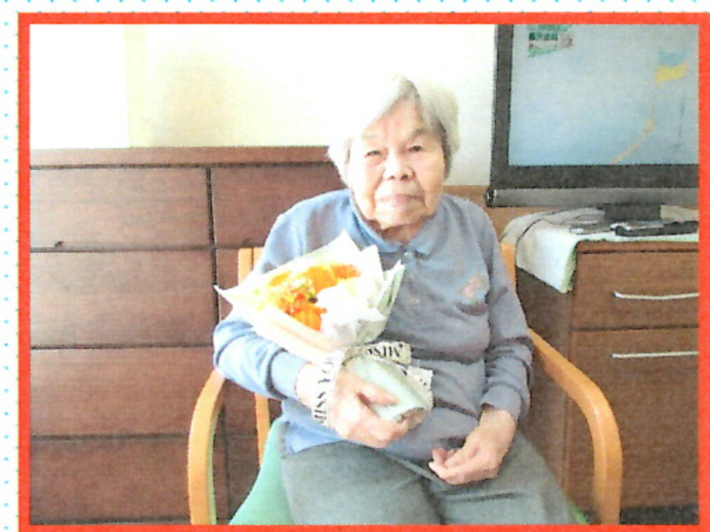
地域密着特養のご利用者には母の日の花束が届きました!(^^)!