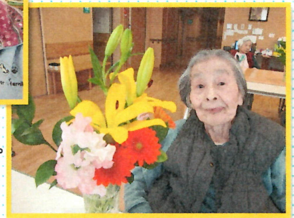
ユニット特養でのひとコマ。ご自身で活けた綺麗なお花と一緒に、いい笑顔です！