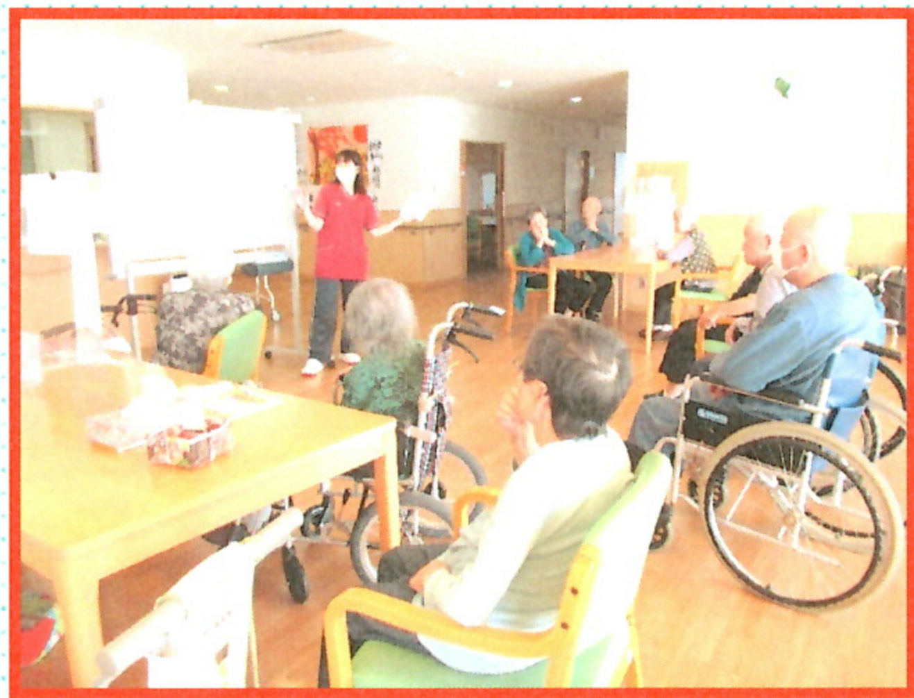
ショート・ひと足お先にお正月気分を味わいましたよ ショート・インフルエンザ予防教室のひとコマです