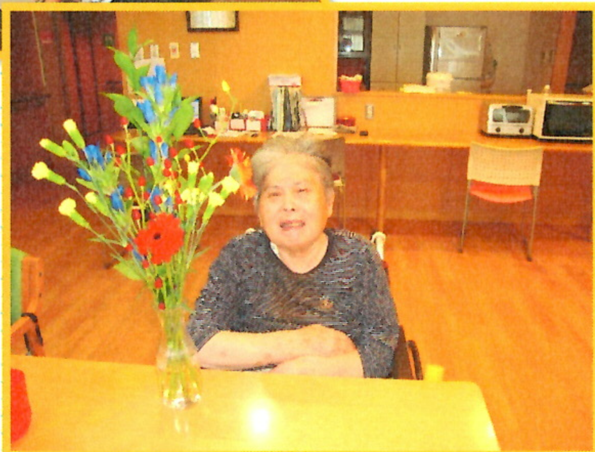
特養・こちらは色とりどりのお花と一緒に📷