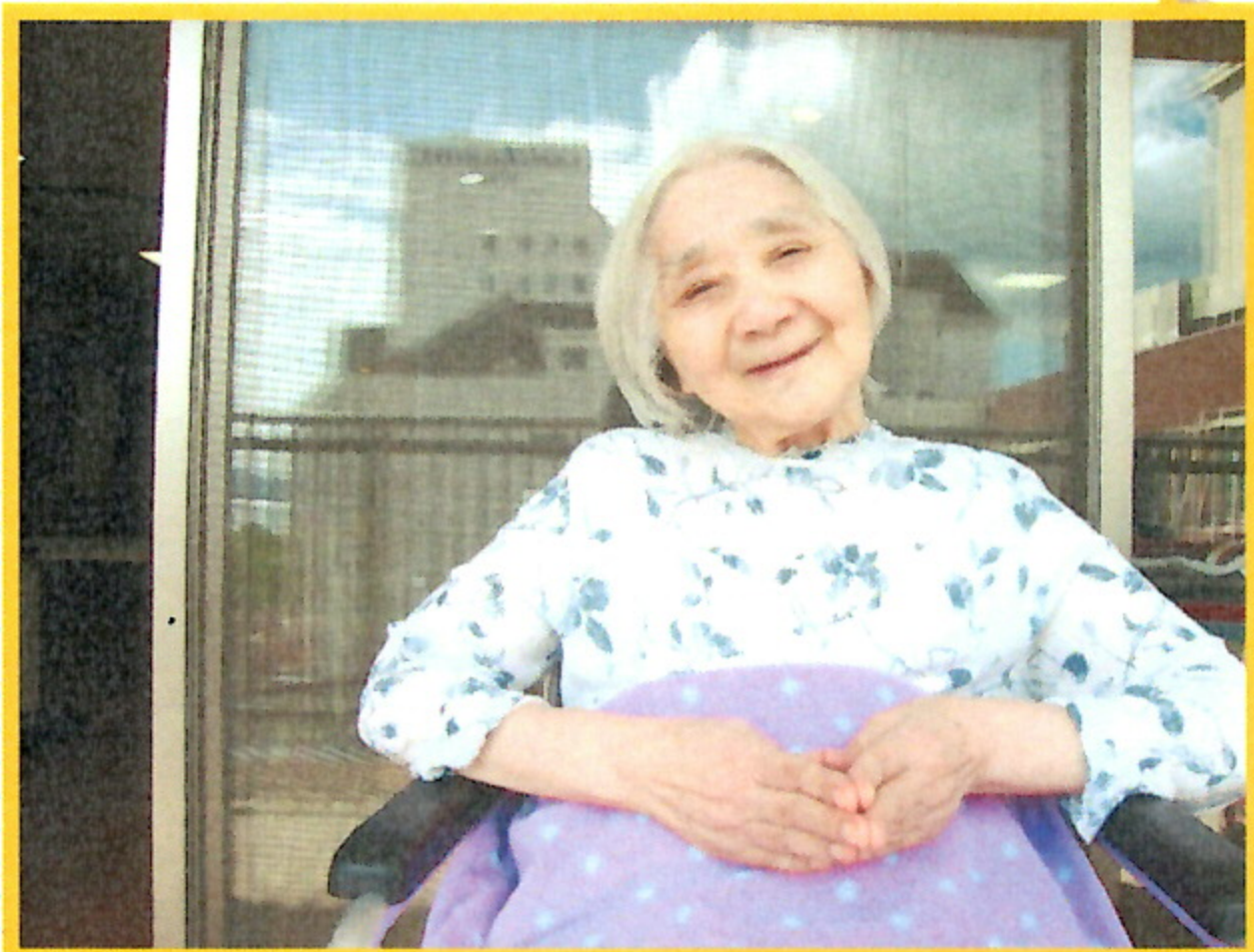
特養・日向ぼっこで、ついウトウト…ZZZ