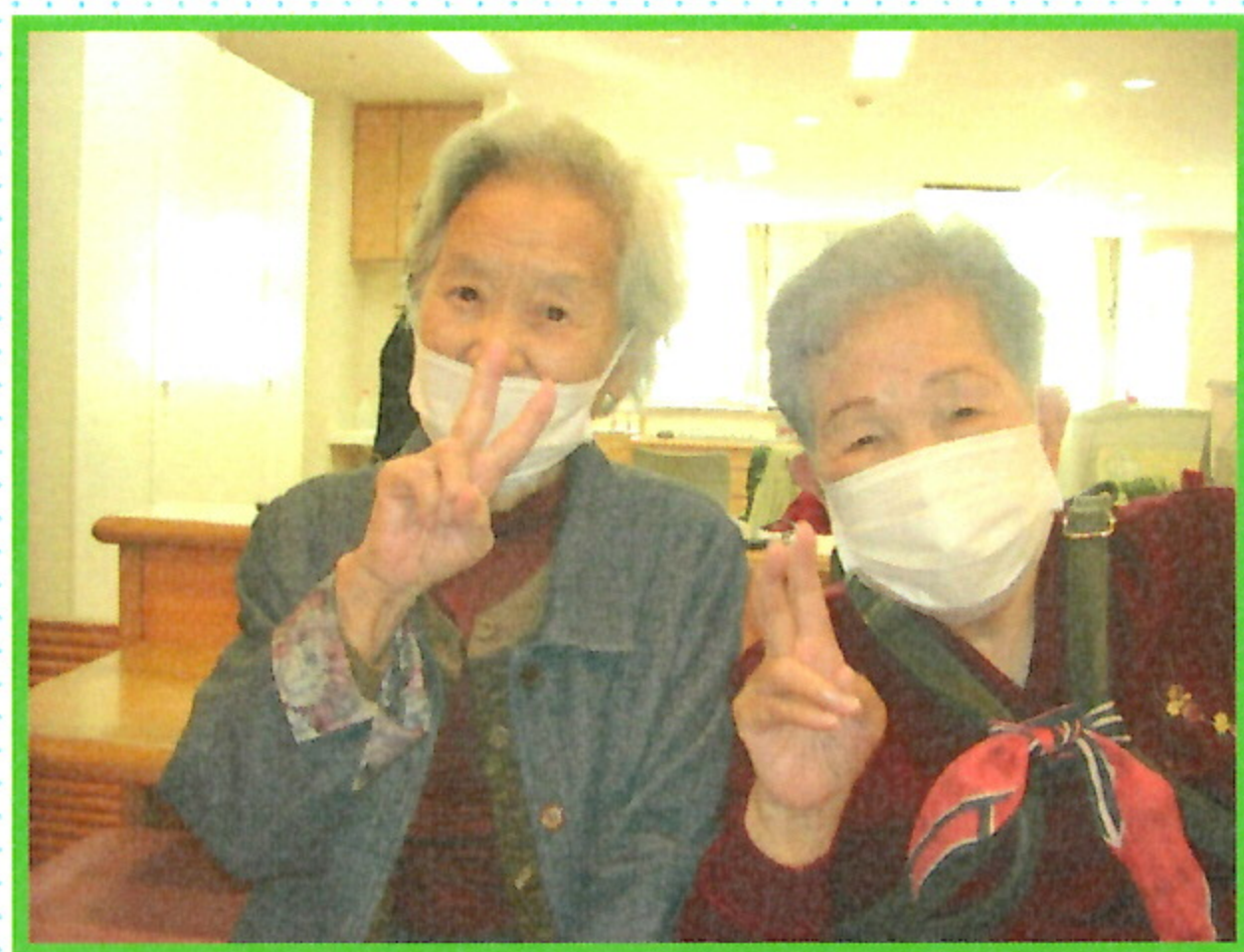
デイ・仲よし同士のツーショット！ ついつい笑顔になってしまいますね(#^_^#)