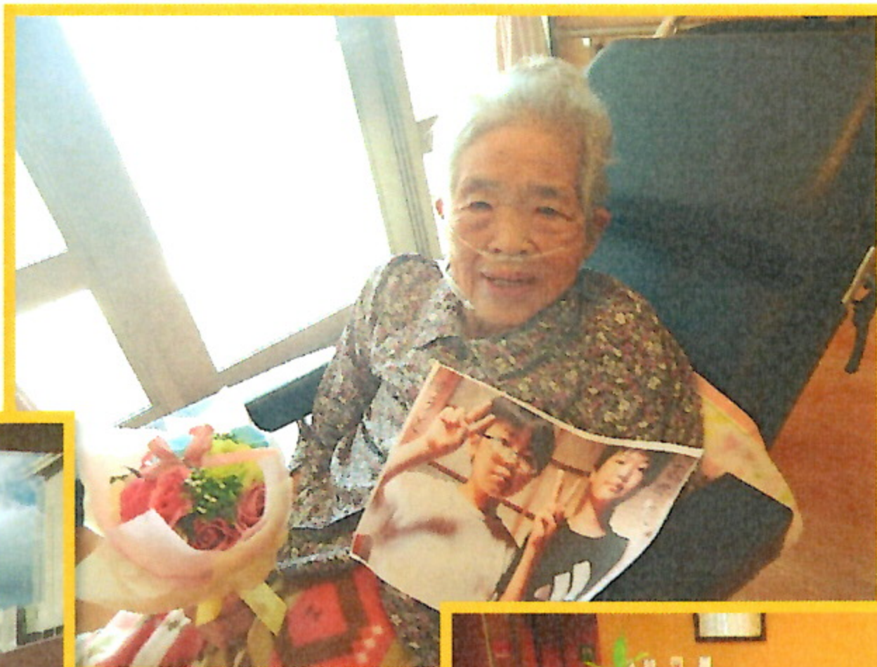
特養・ひ孫さんの 写真と一緒に ハイチーズ！