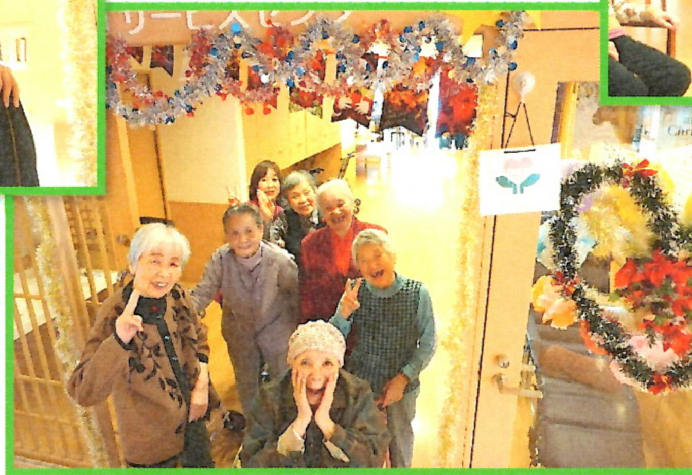
デイサービスではたくさんの笑顔がはじけています! クリスマス飾りをバックに一枚📷、風船卓球に熱中しているところで一枚📷。