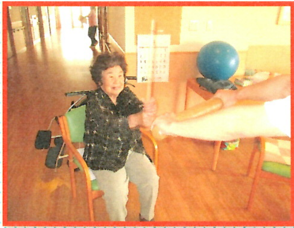
ショートステイでは全身を使った体操を行ったり、数字並べて頭の体操に取り組んでいます!