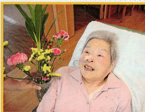
特養でのひとコマ。お花に囲まれ、素敵な笑顔です!(^_^)!