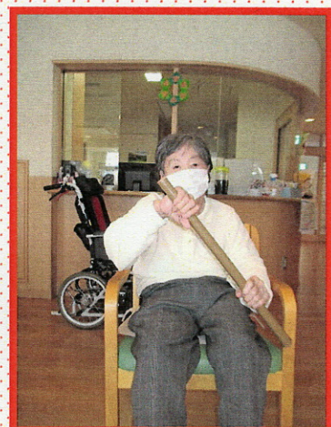
ショートステイでは新聞紙を丸めた棒を使っての体操。真剣な眼差しです！