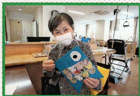
デイサービスでは、かわいい「こいのぼり」を作りましたよ